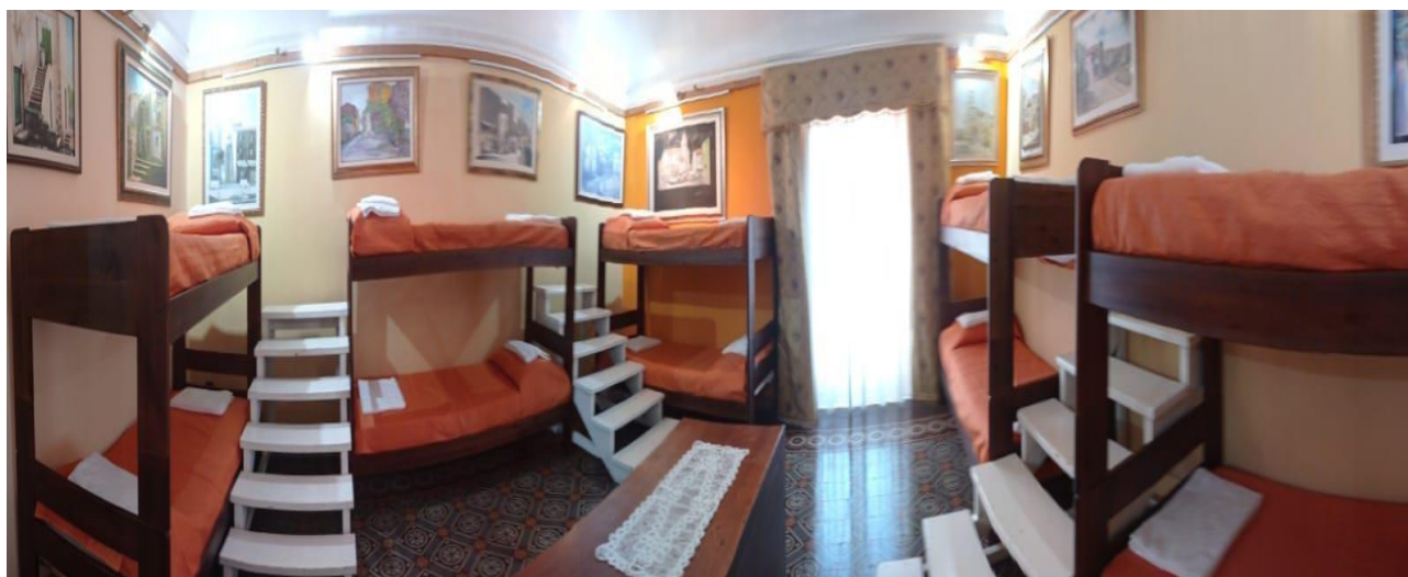
Sala espositiva di villa Pittalà Alberti. All'occorrenza, insieme ad altre sale, viene munita di letti per gli ospiti.