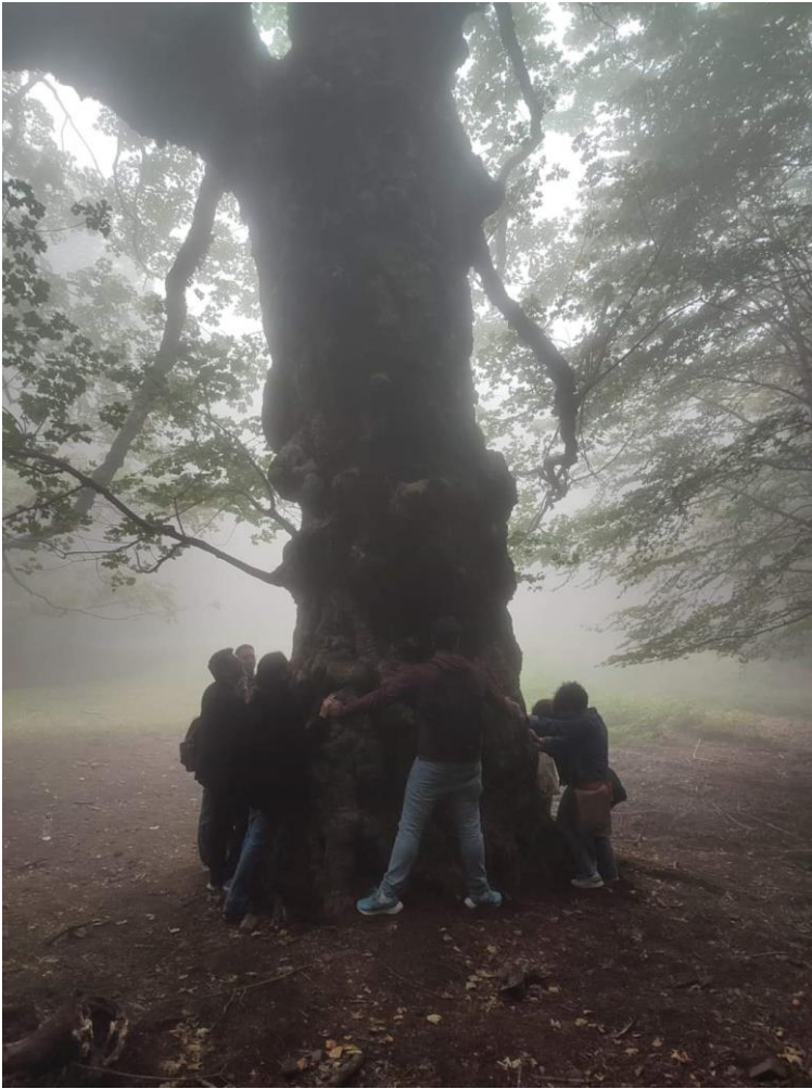
Acerone di Monte Soro