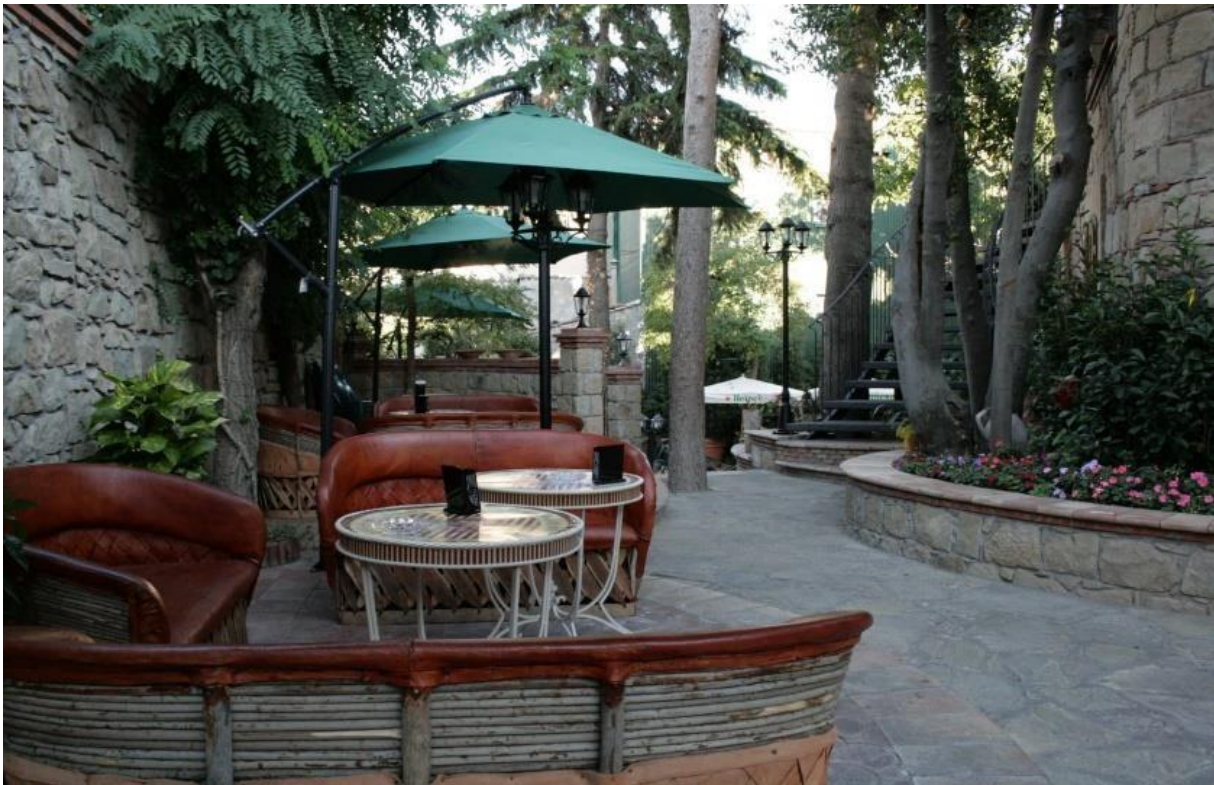
Veduta del patio-giardino di villa Pittalà Alberti.