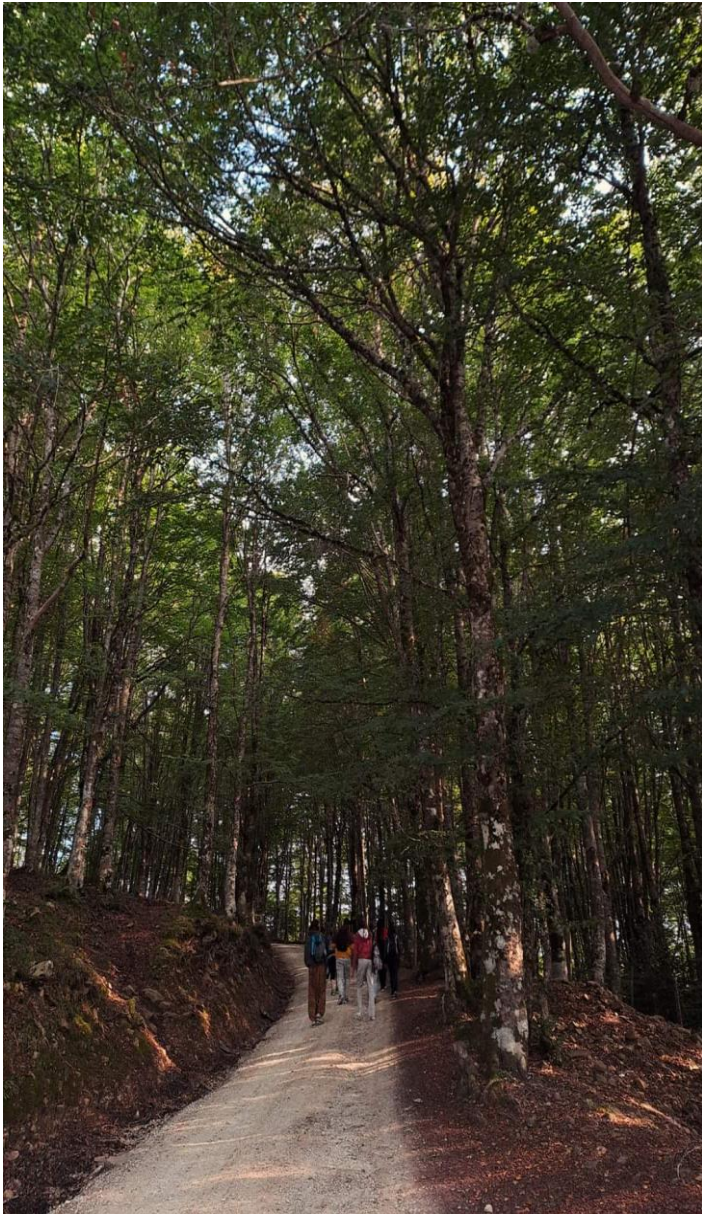
Sentiero Parco dei Nebrodi