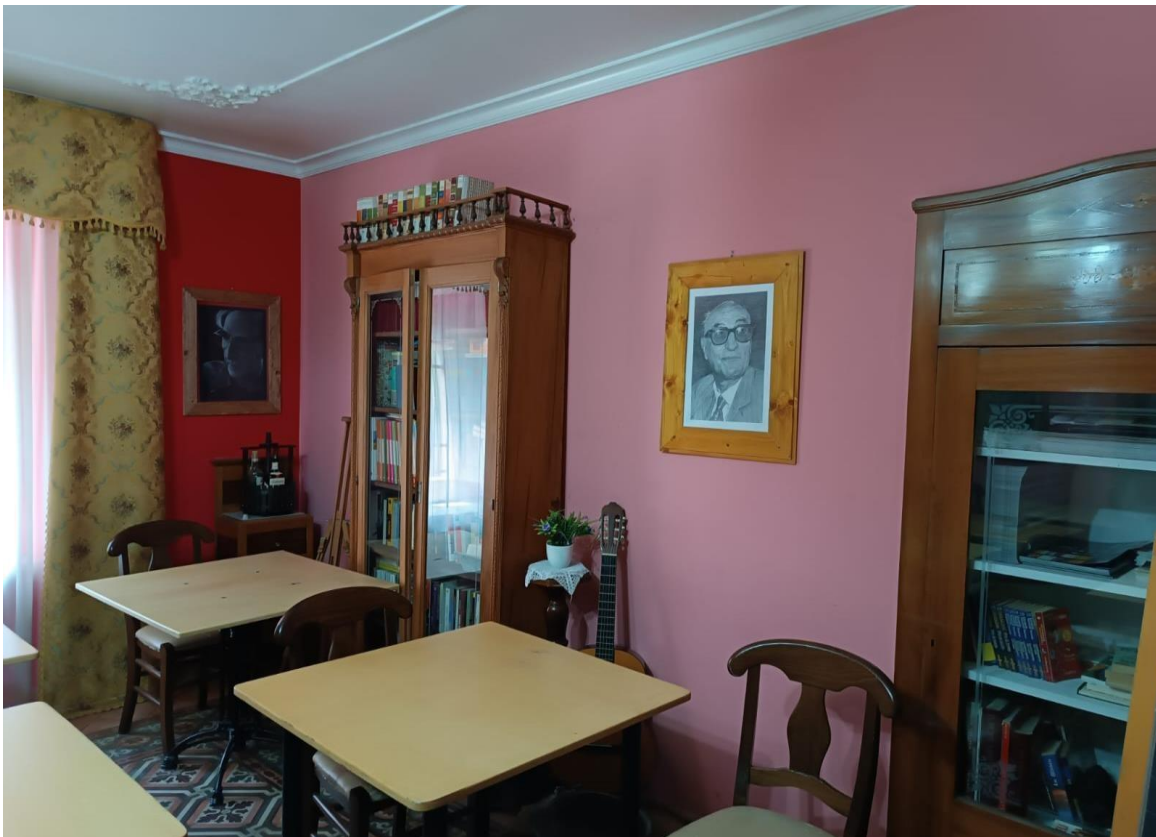
Il salotto dove avvengono gli incontri del caffè letterario G.Bufalino, iniziativa culturale della Pro loco San Teodoro.